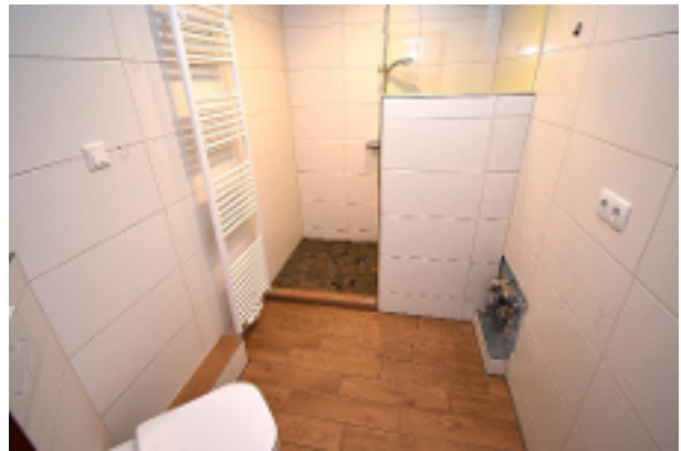
Bad ohne Waschtisch