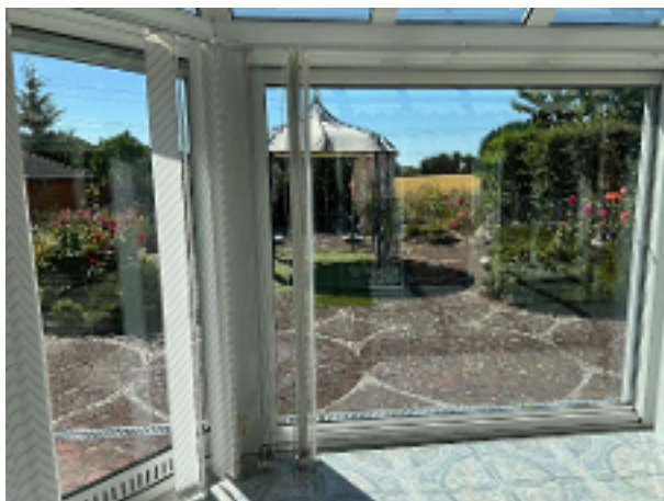
Blick aus dem WiGa