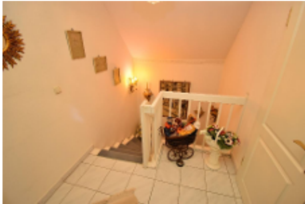
Treppenhaus Flur OG