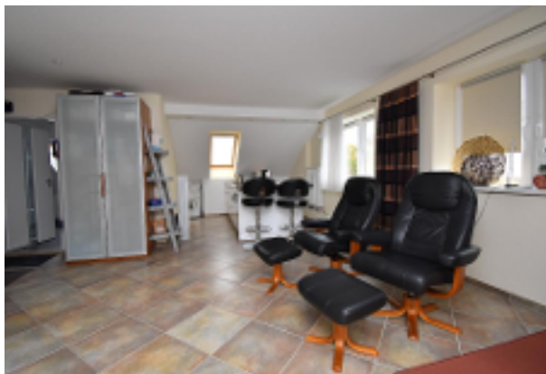
Wohnen mit offener Küche