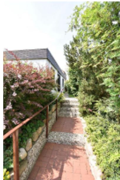
Weg zum Haupteingang