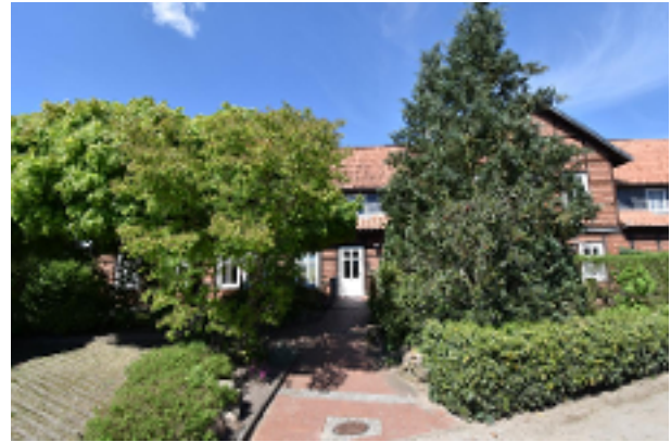
Weg zum Haus