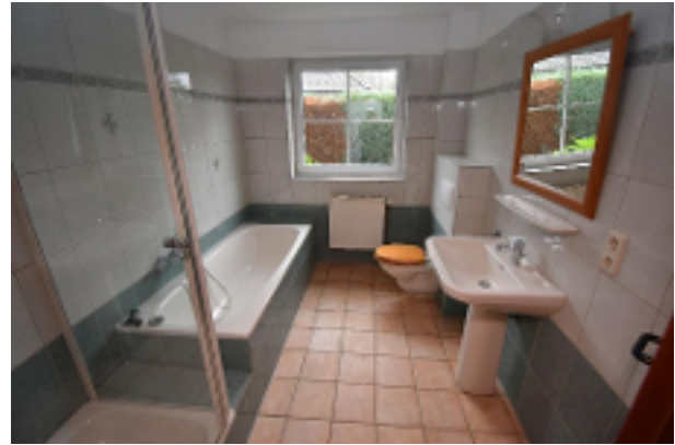
Vollbad mit Dusche und Wanne