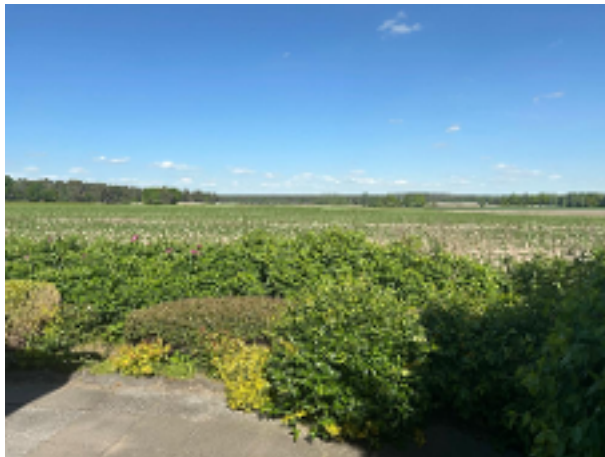
Feldblick von der Terrasse