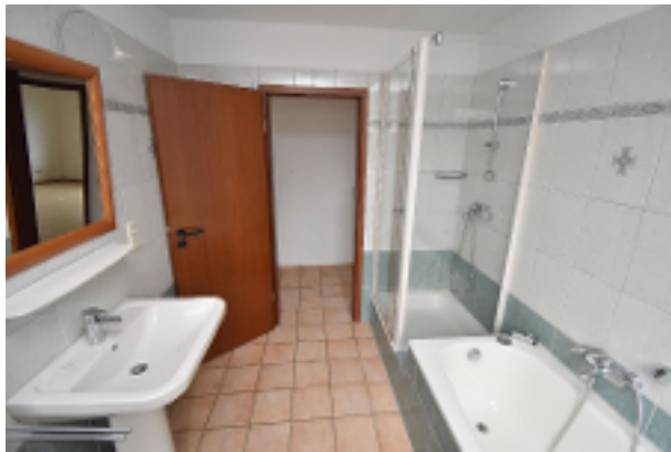
Vollbad mit Dusche und Wanne