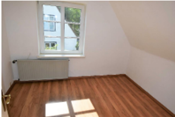
Kleines Zimmer OG