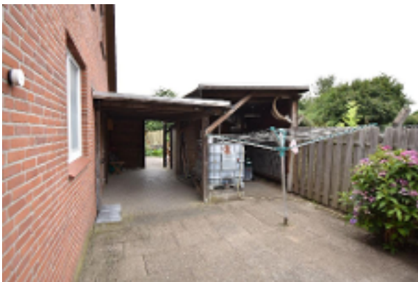
Schuppen hinter dem Haus