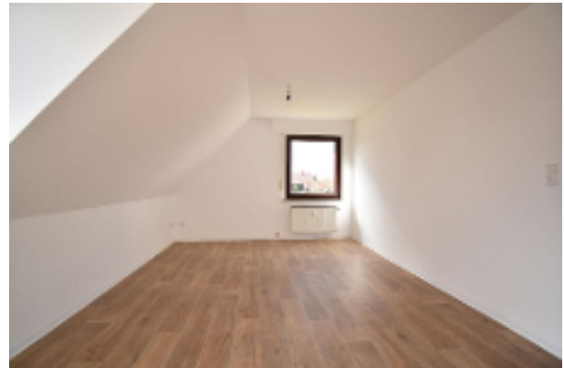
Modernes Zimmer OG-Wohnung