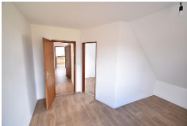
Freundliches Zimmer OG-Wohnung