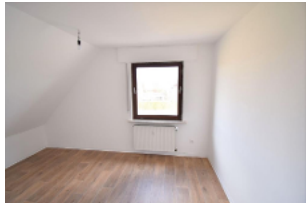
Freundliches Zimmer OG-Wohnung