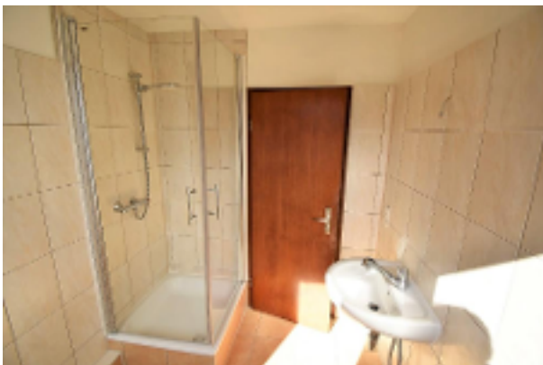
Modernes Duschbad OG-Wohnung