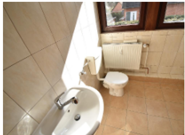
Modern gefliestes Duschbad OG-Wohnung