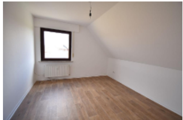
Modernes Zimmer OG-Wohnung