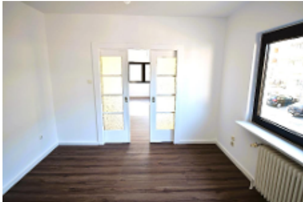
Wohnen mit Schiebetür